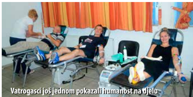
Vatrogasci još jednom pokazali humanost na djelu