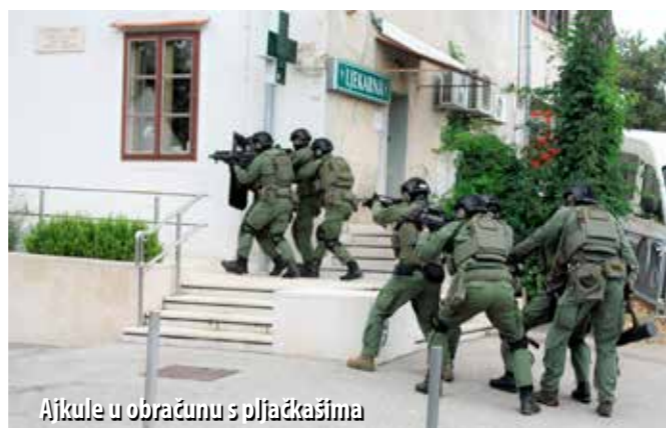
Ajkule u obračunu s pljačkašima