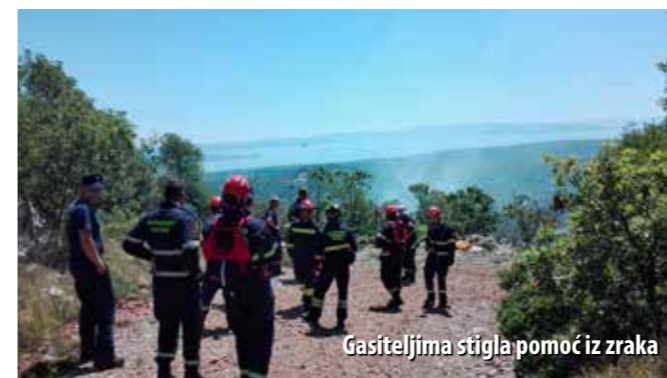
Gasiteljima stigla pomoć iz zraka