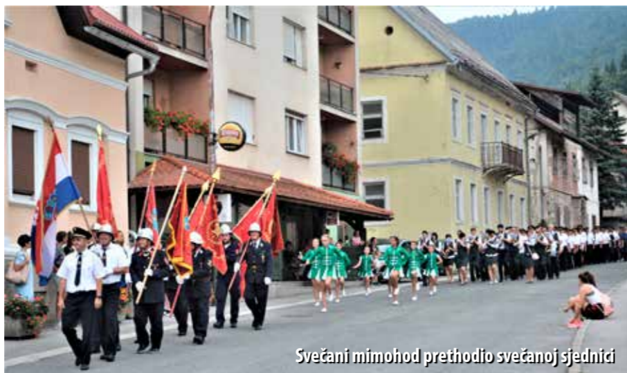
Svečani mimohod prethodio svečanoj sjednici