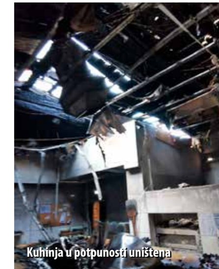
Kuhinja u potpunosti uništena

Na intervenciji je sudjelovalo 30 vatrogasaca s pet vozila. Počinjena šteta procijenjena je na oko milijun kuna, a pretpostavlja se da je požar izazvala neispravna friteza.