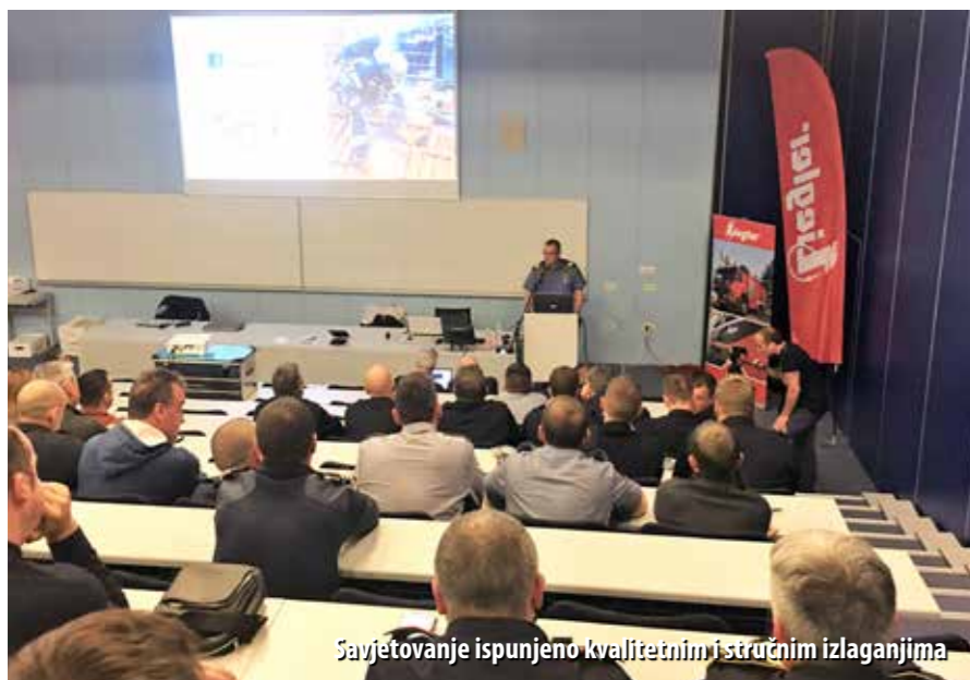
Savjetovanje ispunjeno kvalitetnim i stručnim izlaganjima

tetičkih tvari. Požari se stoga danas razvijaju mnogo brže i potencijalno su vrlo opasni za vatrogasce, budući da produkti sagorijevanja tih tvari sadrže mnogobrojne toksične komponente koje se apsorbiraju u intervencijska odijela i ugrožavaju zdravlje vatrogasca. Jedan od suvremenih izazova jest i gašenje požara na vozilima na alternativni pogon. Za učinkovito postupanje u tim slučajevima, vatrogasci moraju biti upoznati sa svim opasnostima kojima su pritom izloženi, i još važnije – rješenjima kako te opasnosti izbjeći. Iako je tijekom posljednjih 20 godina postignut velik napredak u osposobljavanju vatrogasaca, uvijek iznova treba upotpunjavati specifična znanja, npr. o unaprjeđivanju vatrogasnih tehnika, „čitanju“ požara i dima, napretku u razvijanju moderne osobne zaštitne opreme te, osobito, pravilnom uvježbavanju mladih vatrogasaca-pripravnik. Današnje elektroničko doba to dodatno omogućuje, širom otvarajući vrata za on line učenje. Na internetu su dostupni mnogobrojni video zapisi s intervencija, širok raspon geoprostornih podataka, zračne snimke, fotografije ulica, informacije o zgradama i mnogi drugi podaci koji se, bez sumnje, mogu iskoristiti kao iznimno važni alati za sigurnije i kvalitetnije vatrogasne procedure. O svemu navedenom govorilo se na riječkom savjetovanju, a sve je potkrijepljeno izvrsnim primjerima iz prakse, dobrim i lošim. Sve to na iznimno zanimljiv, stručan i poučan način. Za svaku pohvalu.