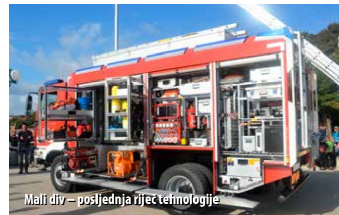
Mali div – posljednja riječ tehnologije

Tehničko vatrogasno vozilo vrijedno je 3,5 milijuna kuna. Na MAN-ovo podvozje nadograđeno je više od 500 komada različite vatrogasne opreme, po čemu je to vozilo među najsuvremenijima u Hrvatskoj.