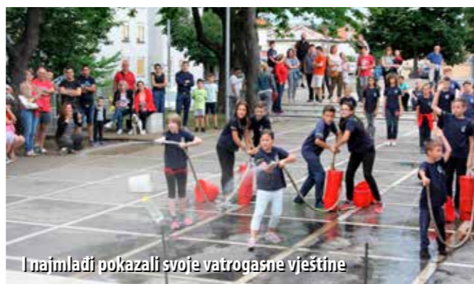
I najmlađi pokazali svoje vatrogasne vještine