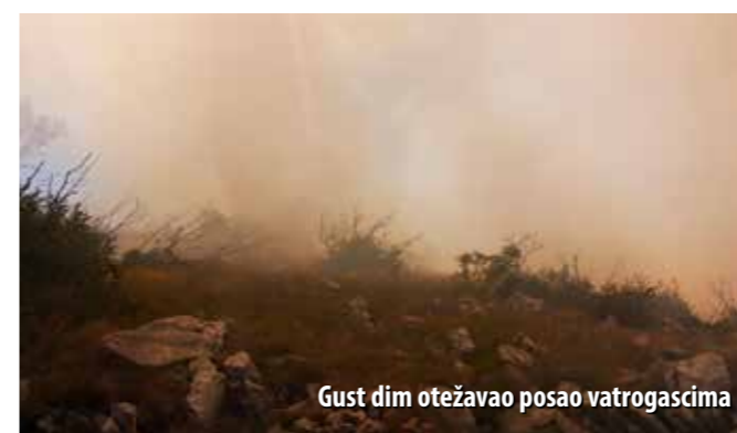
Gust dim otežavao posao vatrogascima