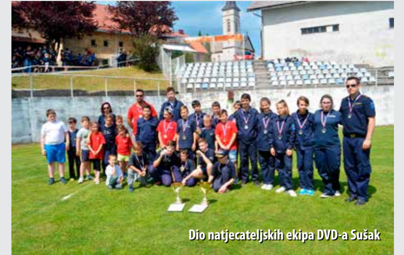
Dio natjecateljskih ekipa DVD-a Sušak

Društvo ima i seniorske ekipe. U posljednjih 20 godina, u kategoriji muški „A“ osvojena su 4 prva mjesta, 5 drugih mjesta i 5 trećih mjesta. Pritom, DVD Sušak tri se puta plasirao i na državna natjecanja. U kategoriji žene „A“ u sedam godina, koliko i postoji ekipa, osvojena su 2 prva, 2 druga i 3 treća mjesta, uz dva plasmana na državna natjecanja. Jedno od najvećih postignuća jest osvojeno 12. mjesto u kategoriji muški „A“ na Državnom natjecanju u Splitu (2008.).