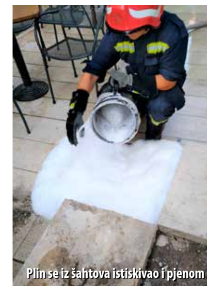
Plin se iz šahtova istiskivao i pjenom

i DTK mreže, mlazom s vatrogasnog vozila, pri čemu su vodom ispunjavali kanalice u kojima je detektirana veća koncentracija plina. U vodovodnim oknima je i dalje bilo plina, a eksplozivna koncentracija plina izmjerena je i unutar strojarne crpne stanice kanalizacije, koja je u vrijeme mjerenja još bila pod naponom. Stoga je u nju ispražnjeno pet kilograma CO 2 iz vatrogasnog aparata, nakon čega je smanjena koncentracija propan-butan plina pa je crpna stanica stavljena izvan napona. Kada se utvrdilo da nema opasnosti od zapaljenja ili eksplozije plinske smjese, crpna stanica je povremeno stavljana pod napon, kako bi se spriječilo izlivanje fekalija na širem području gradske luke, pojašnjava Ličina.