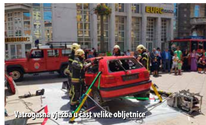
Vatrogasna vježba u čast velike obljetnice

Vrijedan jubilej obilježen je svečanom sjednicom, prezentacijom vatrogasne opreme, predstavljanjem monografije i proglašenjem najboljih radova na temu vatrogastva. Najzaslužnijim članovima Društva dodijeljena su odlikovanja i priznanja.