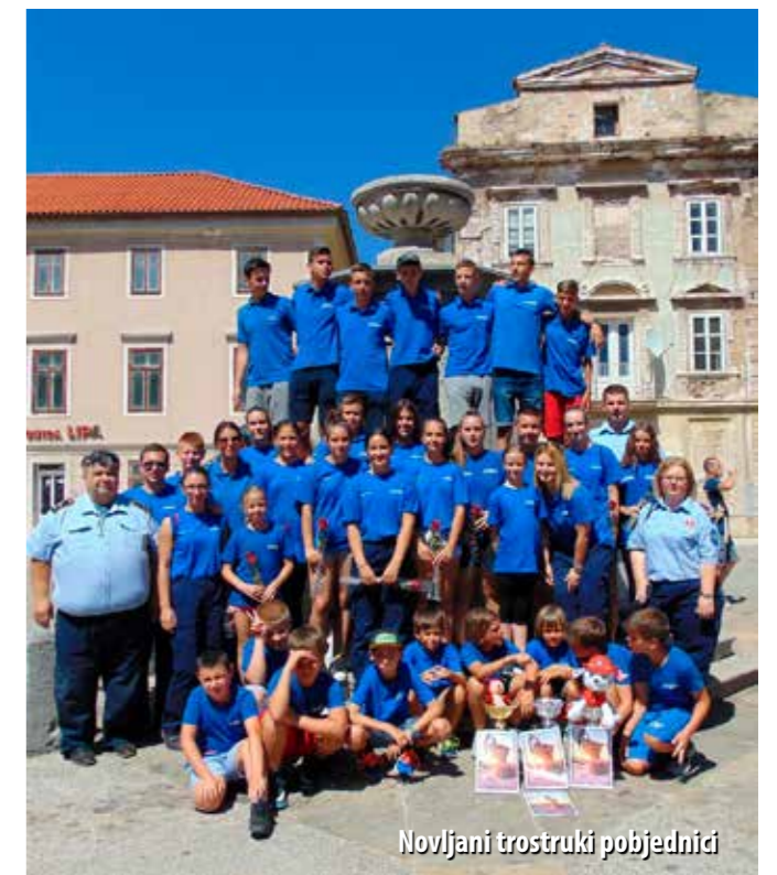
Novljani trostruki pobjednici

Na otvorenju natjecateljske sezone, na 10. memorijalnom međunarodnom Kupu za vatrogasnu mladež „Goran Trupina“ u Novoj Gradiški, nastupile su 33 ekipe iz Hrvatske, Bosne i Hercegovine i Srbije. Ove su se godine u kategoriji muške mladeži natjecale najbolje hrvatske ekipe, a i državni prvaci Srbije. U takvoj konkurenciji, muška mladež iz Novog osvojila je 2. mjesto, a ekipa ženske mladeži bila je najbolja, ostavivši iza sebe i državne prvakinje iz Nuštra. Ukupno gledano, mladež DVD-a San Marino i ove je godine bila najuspješnija na tom natjecanju.