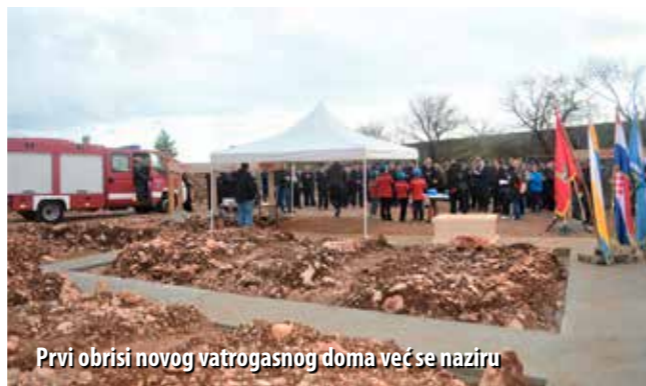
Prvi obrisi novog vatrogasnog doma već se naziru

Vatrogasni dom gradi se na ulazu u Industrijsku zonu Bakar. Investicija je vrijedna 11,5 milijuna kuna, a sredstva je u cijelosti osigurao Grad Bakar. Izvođač radova je tvrtka Novotehna d.d., koja bi cijeli posao trebala dovršiti do kraja sljedeće godine.