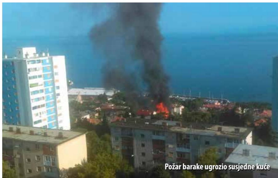
Požar barake ugrozio susjedne kuće

P očetak srpnja gorjelo je i u Rijeci, na Kantridi. U večernjim satima (18.42 h) u riječki JVP stigla je dojava o gustom crnom dimu u gusto naseljenoj ulici Vere Bratonje. Požar je zahvatio baraku „3. maja“, površine oko 80 m 2 . Plamen koji se dizao nekoliko metara u zrak opasno je zaprijetio susjednim kućama koje se nalaze u neposrednoj blizini. Riječki profesionalci, njih 14, s dva navalna vozila i dvije autocisterne brzom su akcijom uspjeli u manje od sat vremena pogasiti požar pa do širenja vatre nije došlo. Ipak, snažna je vatra prouzročila oštećenja na najbližoj susjednoj kući i dva vozilima. Očividom je utvrđeno da uzrok požara nije bio tehničke naravi.