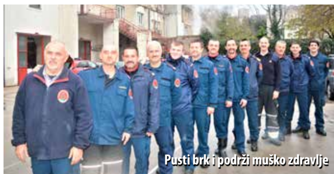
Pusti brk i podrži muško zdravlje

Movember je 2003. godine pokrenulo nekoliko Australaca, sa željom da puštanjem brkova skrenu pozornost na rak prostate. Svoju ideju nazvali su Movember, spajajući riječi moustache (brk) i November (studen). Akcija se ubrzo proširila svijetom, a zadnjih godina provodi se i u Hrvatskoj.