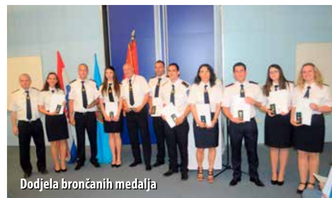
Dodjela brončanih medalja