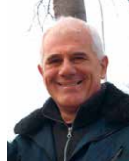
Piše: Slavko Suzić

Nakon polaganja vijenaca, duž bakarske rive zapaljeni su krjesovi, njih čak 250, u čast svih poginulih i preminulih vatrogasaca.