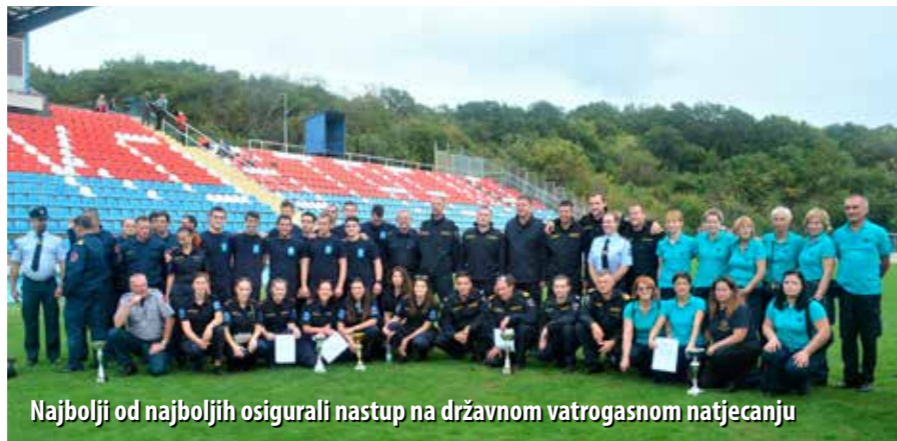
Najbolji od najboljih osigurali nastup na državnom vatrogasnom natjecanju

Tri prvoplasirane ekipe iz svake kategorije stekle su pravo sudjelovanja na državnom natjecanju, koje će se održati dogodine. Tako će u kategoriji muški „A“ dogodine, s ostalim ekipama iz Hrvatske, snage odmjeriti prvoplasirana ekipa DVD-a Sušak, drugoplasirani DVD Delnice i trećeplasirani DVD Crikvenica. U kategoriji muški „B“ u Kostreni su najbolji bili DVD Delnice, DVD Kraljevica te DVD Škrljevo, dok su u kategorijama PVP-A i PVP-B, pravo nastupa na državnom natjecanju izborile ekipe JVP-a Opatije i JVP-a Rijeke, ujedno i jedine ekipe koje su nastupile u tim kategorijama.