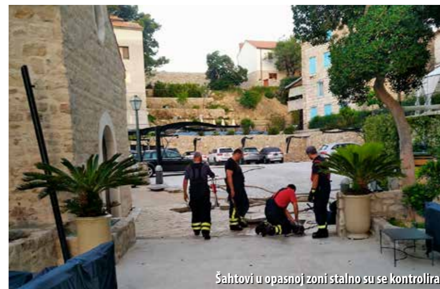
Šahtovi u opasnoj zoni stalno su se kontrolirali

- Naše daljnje aktivnosti bile su konstantno mjerenje koncentracija plina i provjetranje okana. S obzirom da se radi o velikom akcidentu i na većem području, JVP Grada Rijeke posudio nam je dio njihove opreme. Tijekom 25. i 26. lipnja intenzivno smo ventilirali prostorije objekata i okna nadtlaknim ventilatorima iz DVD-a Rab i JVP-a Rijeka, pogonjenim vodom. Budući da je plin detektiran i u fekalnoj kanalizaciji te DTK mreži, angažirano je i Komunalno društvo Vrelo, koje je postavilo balone i zabrtvilo širenje plina kroz kanalizacijska okna izvan ograđenog područja. Specijalnim vozilom kanal-jet izvršeno je "povlačenje" plina prema crpnoj stanici, vodenom lepezom. Istodobno, vatrogasci su obavili ispiranje