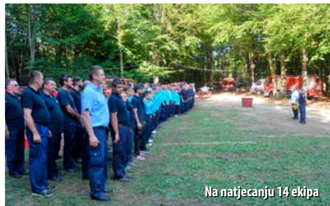
Na natjecanju 14 ekipa