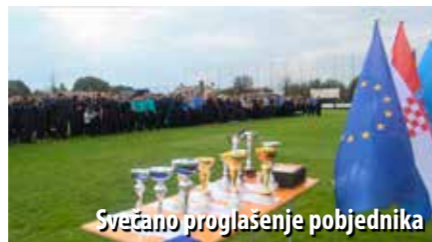
Svečano proglašenje pobjednika

Žene su se natjecale u dvama kategorijama, „A“ i „B“. U „A“ kategoriji slavile