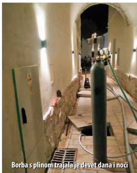
Borba s plinom trajala je devet dana i noći