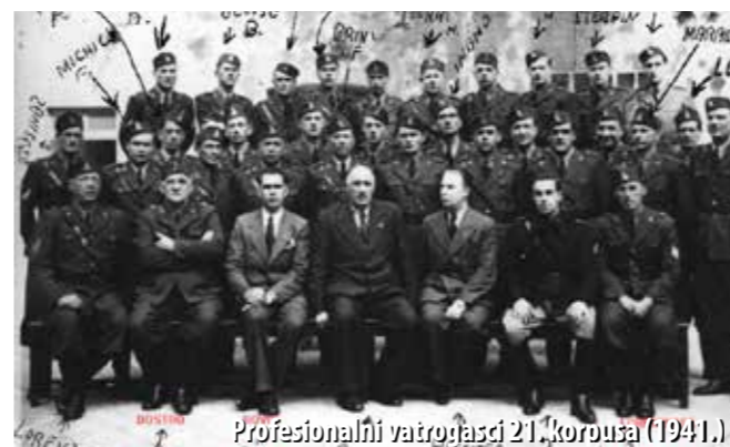
Profesionalni vatrogasci 21. korpusa (1941.)