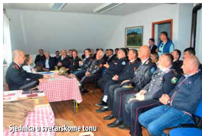
Sjednica u svečarskome tonu