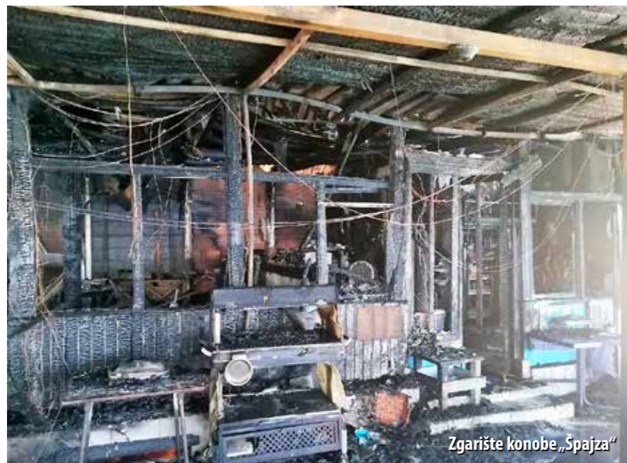
Zgarište konobe „Špajza“