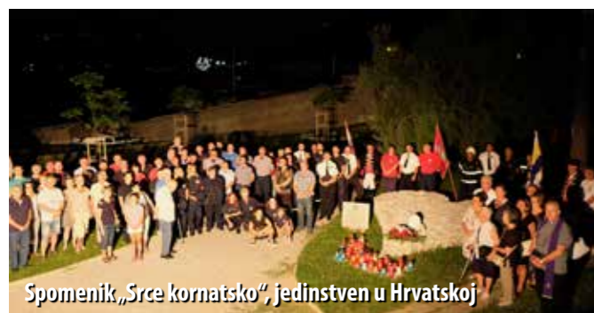
Spomenik „Srce kornatsko“, jedinstven u Hrvatskoj

Svečano i dostojanstveno bilo je u Bakru 30. kolovoza, kada su vatrogasci Grada Bakra i okolnih područja tradicionalno odali počast žrtvama kornatske tragedije, ali i svim ostalim vatrogascima, stradalima tijekom intervencija.