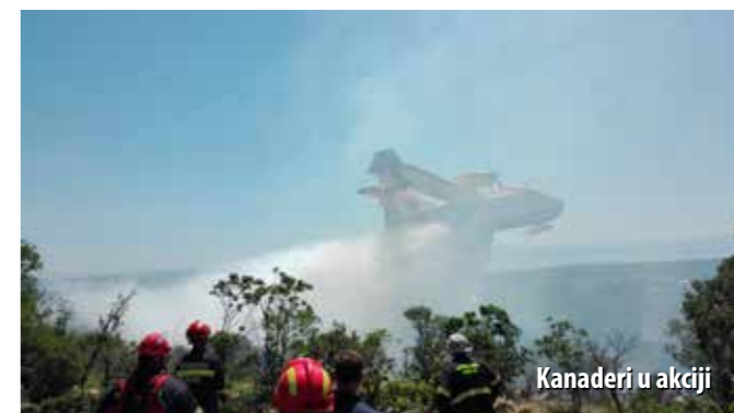
Kanaderi u akciji