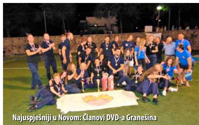
Najuspješniji u Novom: Članovi DVD-a Granešina