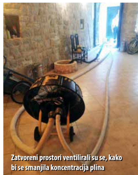
Zatvoreni prostori ventilirali su se, kako bi se smanjila koncentracija plina