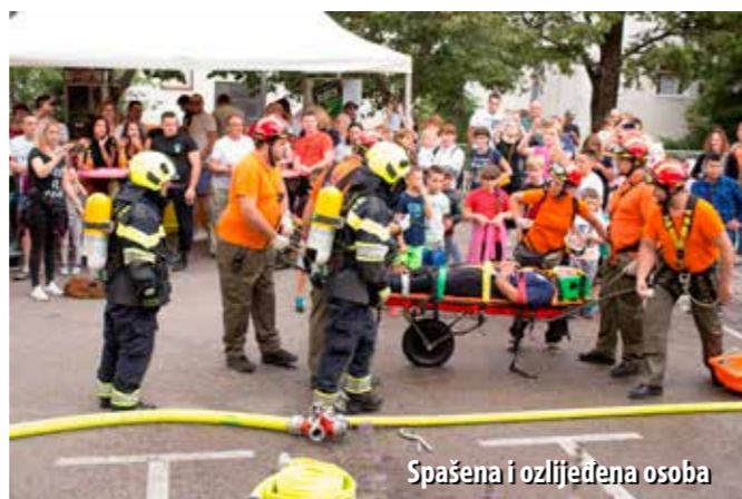
Spašena i ozlijeđena osoba