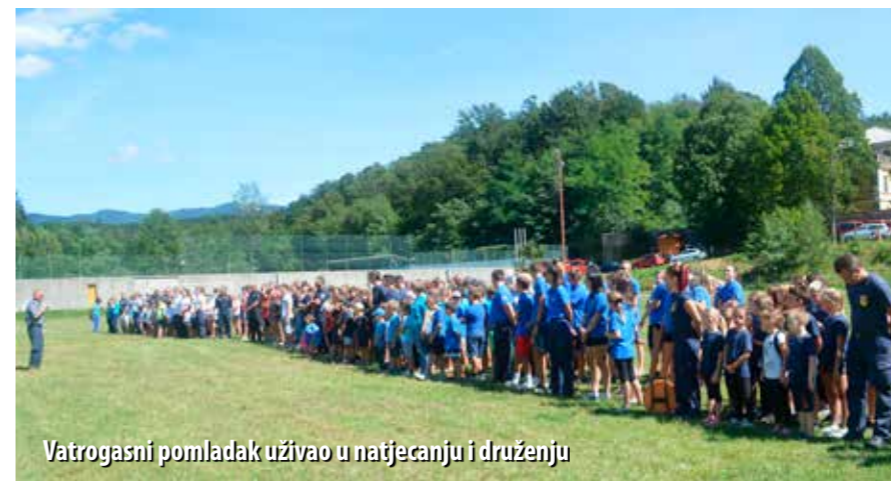
Vatrogasni pomladak uživao u natjecanju i druženju

U povodu blagdana Rokova, Dana Općine Klana, u Klani je 17. kolovoza održano 17. rokovsko natjecanje vatrogasne djece i mladeži, u organizaciji DVD-a Klana. Na natjecanju su nastupile 33 ekipe iz 18 DVD-ova Primorsko-goranske, Međimurske, Krapinsko-zagorske, Ličko-senjske, Splitsko-dalmatinske i Zagrebačke županije.