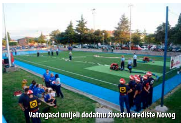
Vatrogasci unijeli dodatnu živost u središte Novog

U organizaciji DVD-a San Marino-Novi Vinodolski i pod pokroviteljstvom Grada Novi Vinodolski, početkom kolovoza održan je 15. Memorijal „Jasmin Filipović“. Nastupile su 23 ekipe, njih 16 u muškoj i sedam u ženskoj konkurenciji. Dvostruki pobjednik memorijala ove je godine bio DVD Granešina, koji je slavio u obje kategorije, ispred DVD-a Buševac i domaćina u muškoj, te DVD-ova Hrašće i Sušak u ženskoj konkurenciji.