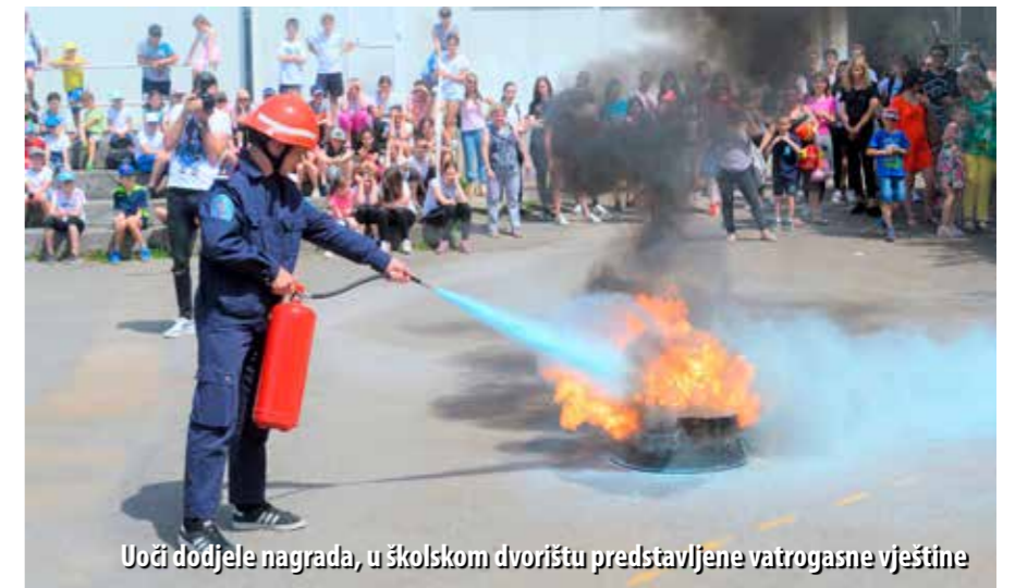
Uoči dodjele nagrada, u školskom dvorištu predstavljene vatrogasne vještine

U sklopu proslave 120. obljetnice DVD-a Sušak, u središtu Rijeke održana i prezentacija vatrogasne tehnike i opreme, uz nekoliko pokaznih vježbi u kojima su, pored DVD-a Sušak, sudjelovali i vatrogasci JVP-a Grada Rijeke te DVD-a Drenova.