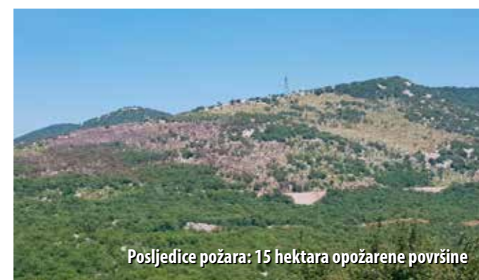
Posljedice požara: 15 hektara opožarene površine

Posljednji dan lipnja u zaleđu Škrljeva, ponad Bakarškoga zaljeva, izbio je požar otvorenoga prostora, uz željezničku prugu na dionici Škrljevo-Meja. Požar potpomognut vjetrom i visokim temperaturama brzo se širio teško pristupačnim i brdovitim terenom.