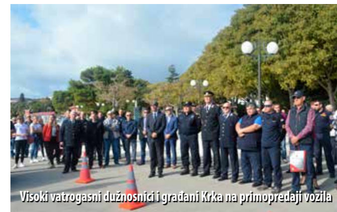
Visoki vatrogasni dužnosnici i građani Krka na primopredaji vozila

Mnogobrojnim visokim vatrogasnim dužnosnicima te građanima Krka, Petrov je s ponosom napomenuo da je riječ o iznimnom vozilu, u koje je ugrađena uistinu impresivna vatrogasna oprema. – Podvozje je proizvođača MAN, oznake TGM 13.290 4x4 BL FW, što definira ojačanu vojno-vatrogasnu verziju podvozja, s ukupnim opterećenjem od 16 t. Motor vozila je Euro 5, snage 213 kW (290 KS), s kratkom kabinom za vozača i dva suvozača. Pogon je na sva 4 kotača (4x4), s blokadama diferencijala na prednjoj i zadnjoj osovini. Mjenjač je automatizirani, s 12 brzina. Podvozje je