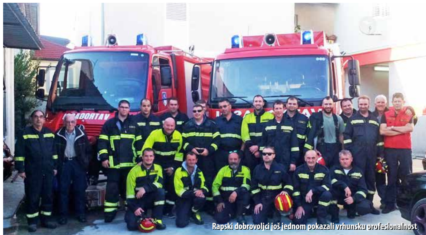
Rapski dobrovoljci još jednom pokazali vrhunsku profesionalnost

Curenje plina ugrozilo je ljudske živote i imovinu pa je dio stare jezgre grada Raba evakuiran, a opskrba električnom energijom povremeno je prekidana. Profesionalnom intervencijom rapskih vatrogasaca, nakon devet dana plinska kriza je okončana, bez štetnih posljedica.