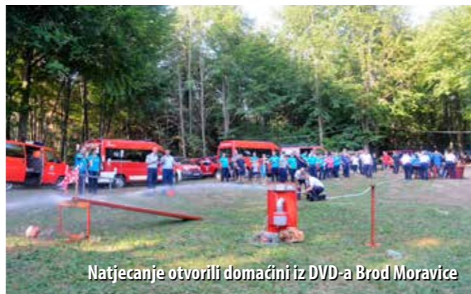
Natjecanje otvorili domaćini iz DVD-a Brod Moravice

U organizaciji DVD-a Brod Moravice i uz potporu Vatrogasne zajednice PGŽ-a, ispred lovačke kuće „Lazica“ u srpnju je održan je 6. Kup Brod Moravica, natjecanje na više od 100 godina staroj brodmoravičkoj zaprežnoj vatrogasnoj šprici.