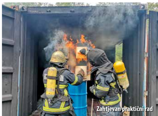
Zahtjevan praktični rad