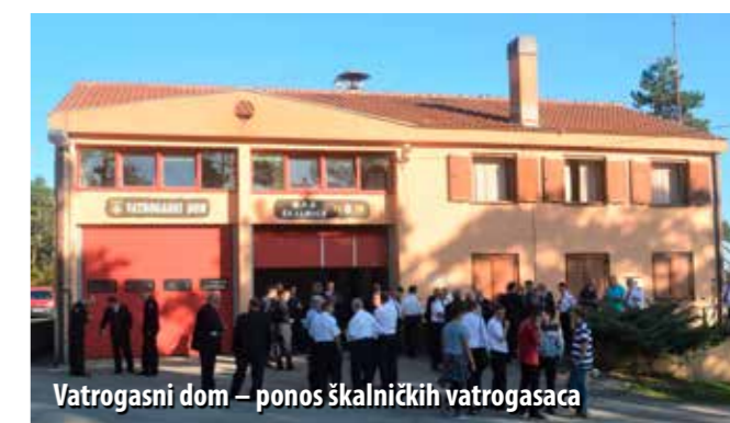
Vatrogasni dom – ponos škalničkih vatrogasaca