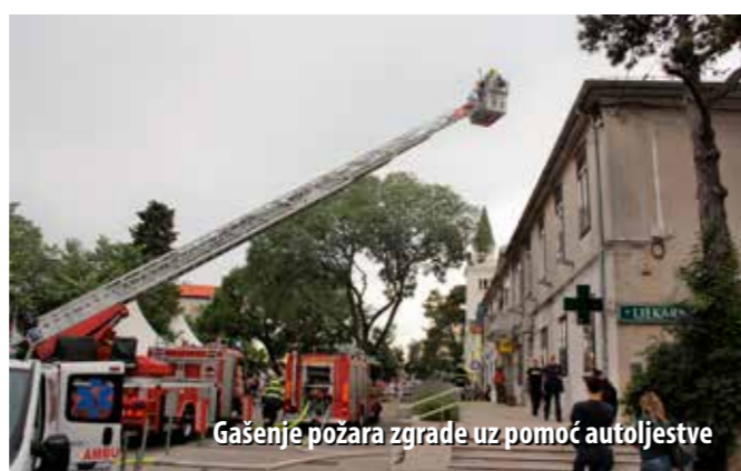
Gašenje požara zgrade uz pomoć autoljestve