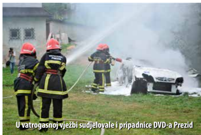
U vatrogasnoj vježbi sudjelovale i pripadnice DVD-a Prezid

DVD Čabar najteže je trenutke proživljavao tijekom Prvog i Drugog svjetskog rata, ali je, zahvaljujući entuzijazmu svojih članova, uvijek uspijevaao „stati na noge“. Prvi vatrogasni dom u Čabru je otvoren 1936. godine, a 1969. godine otvoren je novi dom, koji je detaljnije obnovljen prije 10 godina. Za svoj predan rad, čabarski su vatrogasci 1961. godine dobili zlatnu medalju za požrtvornost, 1969. godine uručena im je i zlatna medalja za naročite zasluge u unapređenju dobrovoljnog vatrogastva, 1973. godine dobili su orden zasluga za narod sa srebrnom zvijezdom, a 2009. godine HVZ im je dodijelio povelju s likom Mirka Kolarića.