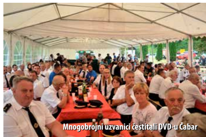
Mnogobrojni uzvanici čestitali DVD-u Čabar