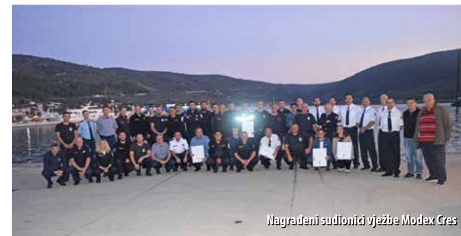
Nagrađeni sudionici vježbe Modex Cres

Sudionicima vježbe Modex Cres dodijeljeni su certifikati za uspješnu realizaciju te velike međunarodne vatrogasne vježbe, koja je, u sklopu Mehanizma civilne zaštite EU-a, prvi put realizirana u Hrvatskoj, od 7. do 10. travnja ove godine. Dodjela certifikata održana je sredinom listopada na Cresu, a pored vatrogasaca, priznanja su uručena i predstavnicima