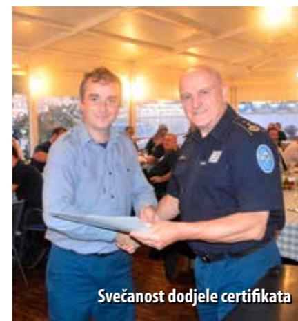
Svečanost dodjele certifikata