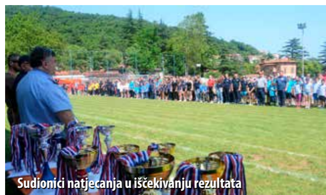
Sudionici natjecanja u iščekivanju rezultata