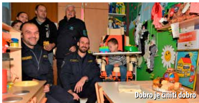
Dobro je činiti dobro

Spomenuta donacija nastavak je potpore koju vatrogasci ne