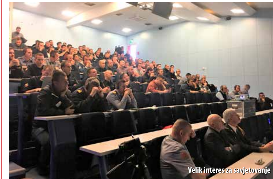
Velik interes za savjetovanje