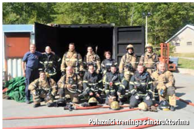
Polaznici treninga s instruktorima

Najvažnije što ovdje želimo naučiti su tehnike i taktike postupanja, kako bismo kontrolirali naše djelovanje, bili učinkoviti, i pri tome sigurni. Moj je najvažniji zadatak prenijeti znanja o svim opasnostima koje donose požari zatvorenih prostora i zato smo fokusirani na modele pomoću kojih će vatrogasci prepoznati što se događa, a potom im dajemo i alate kako će na to odgovoriti. Požari zatvorenih prostora vrlo su specifični i zahtjevni, a više su istraženi u posljednjih 10 godina, nego u prethodnih 100. To intenzivno proučavanje navelo nas je da u potpunosti promijenimo neke dosad općeprihvaćene taktike. Npr., prije smo smatrali da vatrogasci ne smiju pristupiti gašenju takvih požara izvana, ako se unutra nalaze zarobljeni ljudi, jer smo vjerovali da će to ugroziti živote tih ljudi. No, posljednja istraživanja pokazala su da, ako na pravilan način nastupamo izvana, možemo itekako pomoći ljudima koji su zarobljeni u požaru, istaknuo je Reffel.