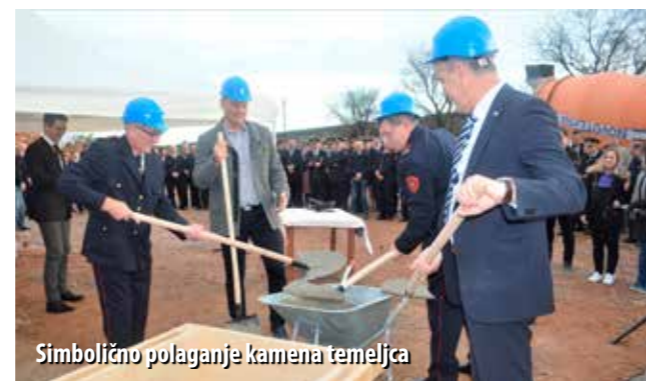
Simbolično polaganje kamena temeljca

Članovi DVD-a Škrljevo i njihovi sumještani zauvijek će pamti proslava 40. obljetnice Društva, održane potkraj studenog. Razlog je više nego dobar. Nakon 20 godina čekanja, počeli su građevinski radovi na izgradnji njihovog novog vatrogasnog doma.